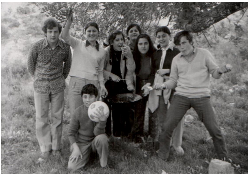
De gira en las Casas Altas, año 1970

Además de servir de cierre al ciclo navideño, se trata ciertamente de dos fechas clave en el calendario murciano más ancestral: una vinculada a la vida ganadera y pastoril, con la que precisamente Sangonera tiene fuertes y antiguos lazos (de entrada, como pueblo emplazado al paso de una vía pecuaria); y otra relacionada con la cristiana costumbre de presentar los niños a la Virgen. No eran desde luego celebraciones tan masivas como las de la Reina de los Ángeles, a las que sí acudían todos los sangonereños en pleno, pero estas del monte resultaban muy alegres y populares para quienes las disfrutaban. La gente se llevaba todo lo necesario para comer allí y algunos recuerdan que, los que tenían moto, acarreaban las capazas y aperos más pesados por el camino que conducía hasta el paraje, mientras que los demás subían andando directamente por el cauce de la rambla del Pocico. Se solían hacer migas o arroz y, si alguna vez se les olvidaba llevar cucharas, utilizaban cascos de cebolla para llevarse la comida de la sartén a la boca. Lo importante era la convivencia y pasarlo bien.