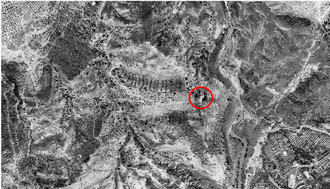
Vista aérea de las Casas Altas en 1956