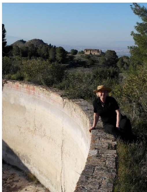
Una integrante del grupo, en el balsón, ayer y hoy. Al fondo, las Casas Altas, el Talayo y la Talaya.