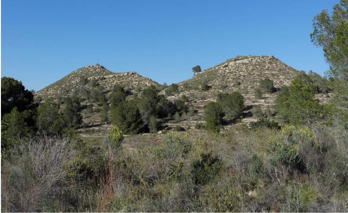
El Talayo y la Talaya

Si hoy el paraje nos produce cierta sensación de aislamiento, más aún debiera parecerles a quienes residían durante todo el año en los desperdigados caseríos que por aquí había: entre otros muchos, Los Arejos, Las Garitas, Los Rufos, Cañá Molina, Casa de la Balsa, Casa de la Fuente del Perro... y las Casas Altas a las que nos dirigimos, sitios todos cargados de historias y de vida, hoy deshabitados. En ellos pasaron la mayor parte de su existencia quienes tenían la importante misión de vigilar los cultivos y mantener en buenas condiciones las distintas haciendas que aglutinaba una finca tan enorme: los caseros y sus familias, oficio que se heredaba de padres a hijos y en el que todos los miembros colaboraban de alguna manera. Los Caliches, Los Peretes, Los Marijuanos, Los Rojos o Los Tirillas , son apodosos recurrentes en las historias que se cuentan sobre el trabajo en Torre Guil. Y es que todos mantuvieron en sus familias este cometido, convertidos muchas veces en el único nexo de unión entre el propietario o el encargado que necesitaba temporeros y la inmensa mano de obra que jornaleros de Sangonera y de otras muchas procedencias ofrecían.