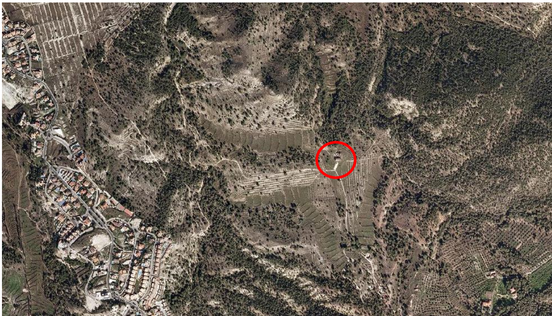
Vista aérea de las Casas Altas en 2009