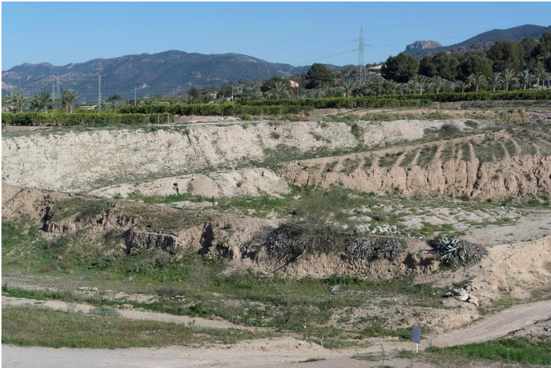
La rambla del Pocico desde la ermita de la Cruz